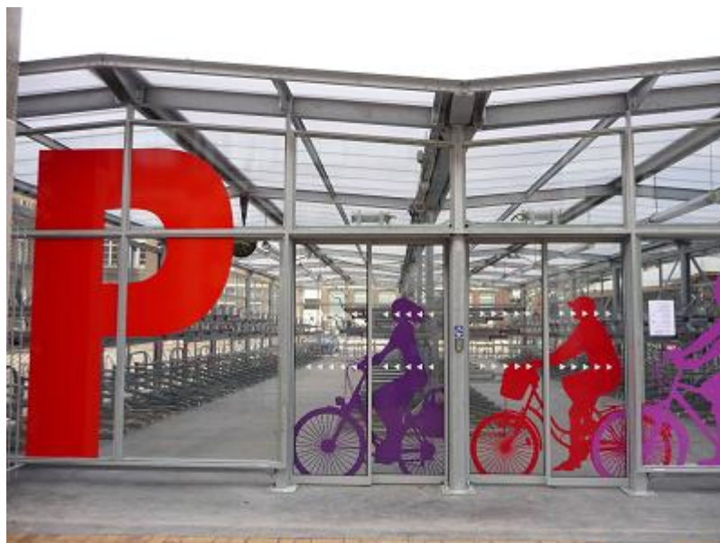
Garage vélo gare de Lille Flandres

La Région Nord - Pas de Calais, organisatrice du Transport Express Régional subventionne l'installation de parkings vélos sécurisés ; A ce jour, 26 gares de la Région sont équipés d'abris vélos sécurisés, et 11 projets sont en cours.