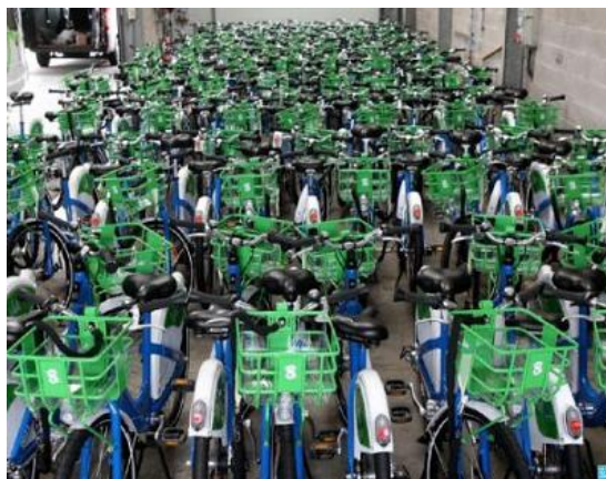
V'lin à Calais

La location de vélos de longue durée pourrait aussi intéresser d'autres publics, en particulier les étudiants.